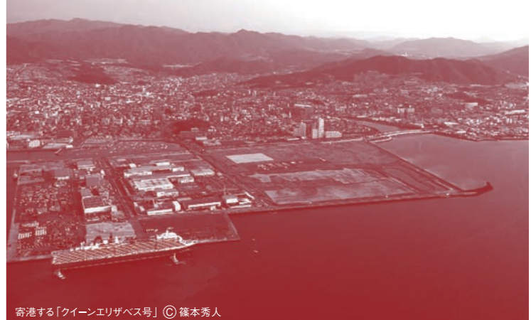
広島港国際コンテナターミナル (出島地区)